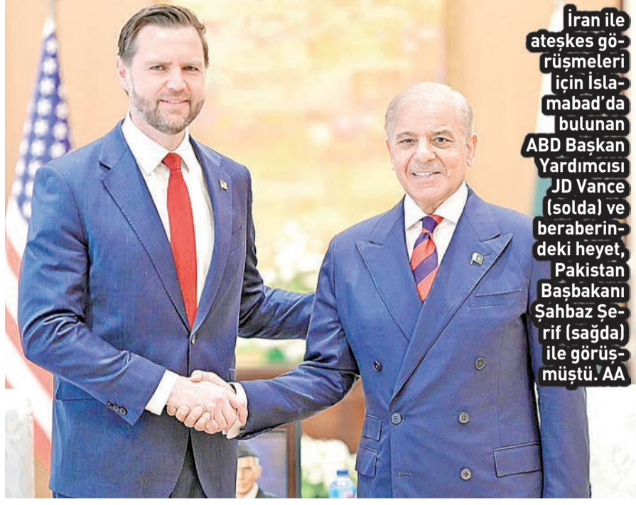
İran ile ateşkes görüşmeleri için Islamabad'da bulunan ABD Başkan Yardımcısı JD Vance (solda) ve beraberindeki heyet, Pakistan Başbakanı Şahbaz Şerif (sağda) ile görüşmüştü. AA

ABD olarak temel taleplerini en net şekilde ortaya koyduklarını ancak İran'ın "bu şartları kabul etmemeyi tercih ettiğini" söyleyen Vance, ABD Başkanı Donald Trump'la da defalarca telefon görüşmelerini kaydetti. Vance, "Buradan ayrılıyor ve çok basit bir teklifle, nihai ve en iyi teklifimiz olan bir mutabakat metniyle ayrılıyor. İranlıların bunu kabul edip etmeyeceğini göreceğiz." şeklinde konuştu. AA