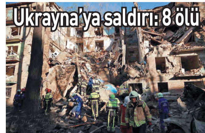
Ukrayna'ya saldırı: 8 ölü

almak olduğunu savundu. Bir başka kaynak ise CIA'in operasyonlarının ölümcül olma oranının son yıllarda ciddi şekilde arttığını belirterek, "Bu, CIA'in Meksika içinde yapmaya istekli olduğu türden şeylerin önemli bir genişlemesi." ifadesini kullandı. AA