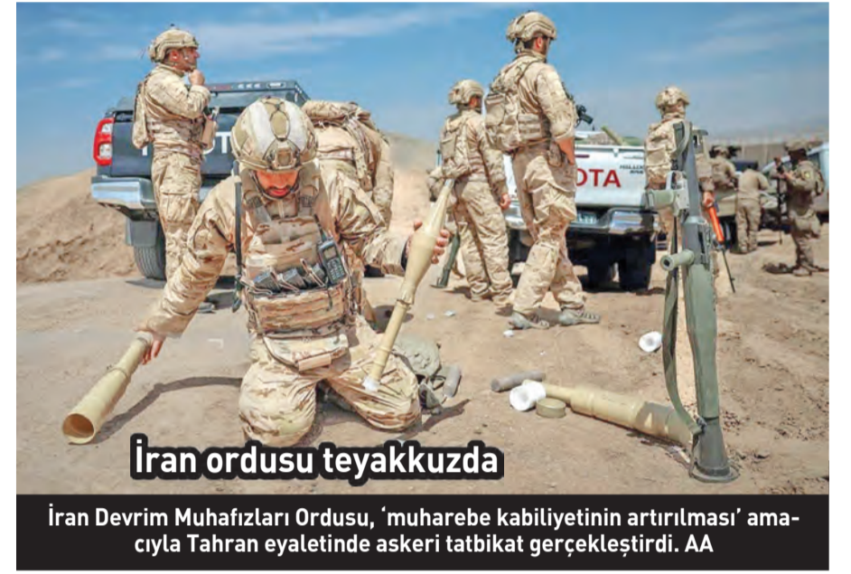
İran ordusu teyakkuzda

Beyaz Saray Sözcü Yardımcısı Olivia Wales, istihbarat değerlendirmelerine ilişkin haberin ardından yaptığı açıklamada, İran ordusunun "ezildiği" yönündeki önceki açıklamaları yinledi. Wales, İran'ın ordusunun yeniden yapılandırıldığını düşünenle-