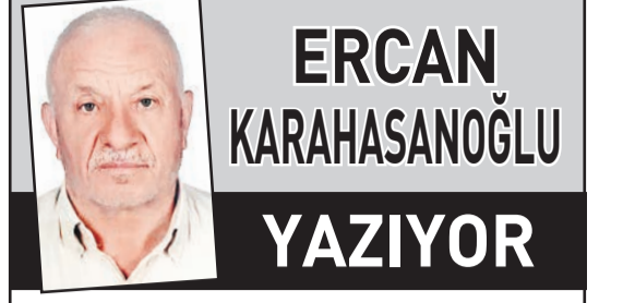
ERCAN KARAHASANOĞLU YAZIYOR

Çevredekilerin haber vermesi üzerine olay yerine gelen sağlık ekiplerince Taşköprü Devlet Hastanesine kaldırılan Güleç, yapılan müdahalelere rağmen kurtarılamadı. Olayın ardından kaçan Uğur E.'nin yakalanması için jandarma ekiplerince çalışma başlatıldı. AA